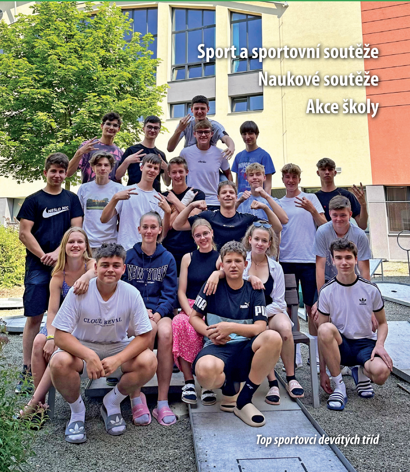
Top sportovci devátých tříd